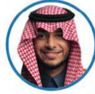
الأمين العام أ. عبدالله بن عبدالله العباس