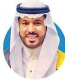
الدكتور منصور بن حسين الجبران المستشار في مجال اضطراب طيف التوحد