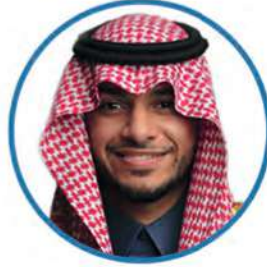
الأمين العام أ. عبدالله بن عبدالله العباس