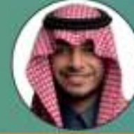
الأمين العام أ. عبدالله بن عبدالله العباس