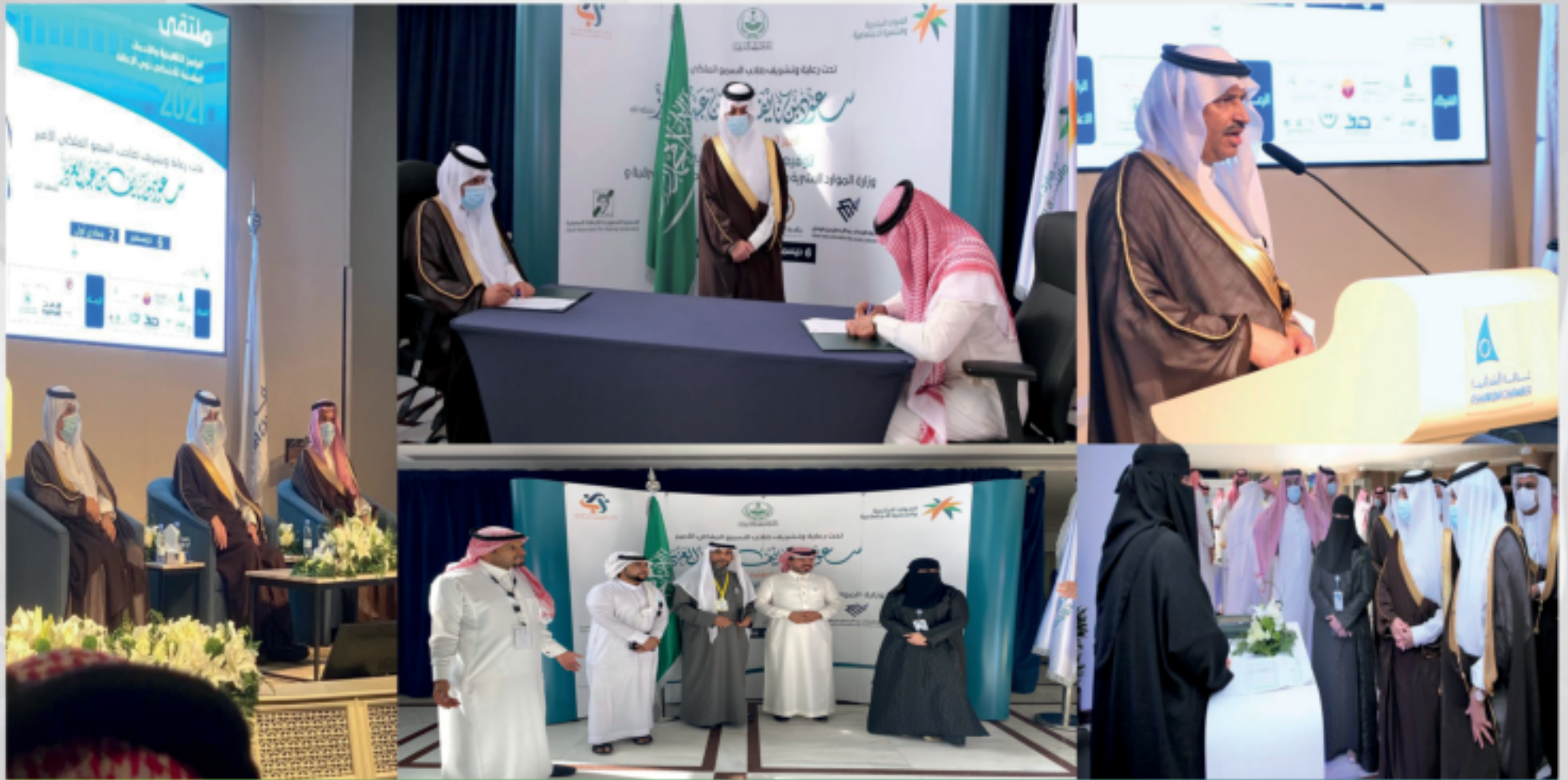
مشاركة الجمعية باليوم العالمي لذوي الإعاقة برعاية كريمة من أمير المنطقة الشرقية صاحب السمو الملكي الأمير سعود بن نايف بن عبدالعزيز الذي نظمته وزارة الموارد البشرية والتنمية الاجتماعية