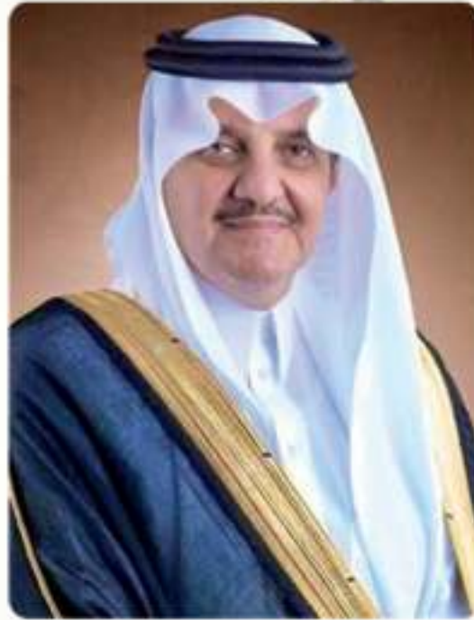
صاحب السمو الملكي الأمير

بدر بن محمد بن جلوي آل سعود محافظ الأحساء