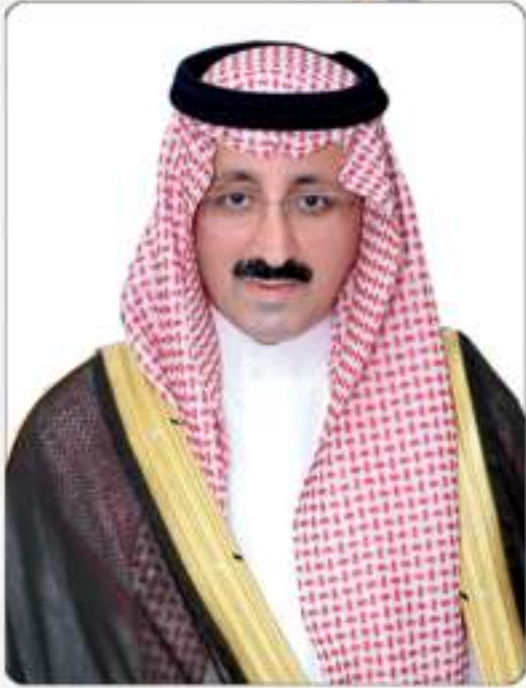
صاحب السمو الأمير

بدر بن محمد بن جلوي آل سعود محافظ الأحساء