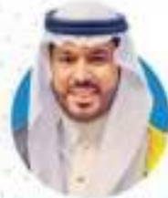
الدكتور منصور بن حسين الجرار المستشار في مجال اضطراب طيف التوحد